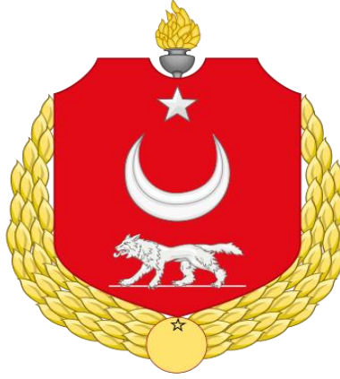
1. Resim: Devlet Arması

Söylem göstergebilim ve duygu değeri açısından Türk yazıt ve armaları üzerine yapılan analiz sonucunda aşağıdaki bulgulara ulaşılmıştır.