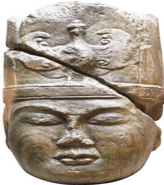
3. Resim: Köl Tigin Heykeli başındaki Umay kuşu tasviri.

Çeşitli efsanelerde de anlatıldığı üzere kurttan süt emen farklı çocuk figürleri bulunmaktadır. Farklı kültürlerde de benzer efsanelere rastlamak mümkündür. Roma, sanat eserleri ve sikkelerinde çok yaygın bir şekilde ve benzer üslupta ortaya çıkan Romus ve Romulus olarak bilinen ikiz çocukların kurttan süt emme figürleri de dikkat çekmektedir (Çoruhlu, 2022). Duygu değeri olarak kurdun bir anne şefkati taşıdığı yönüne burada vurgu yapılmaktadır.