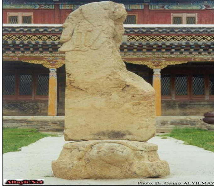
2. Resim: Bugut yazıtında bulunan “Kurttan süt emen çocuk” tasviri.

Çeşitli efsanelerde de anlatıldığı üzere kurttan süt emen farklı çocuk figürleri bulunmaktadır. Farklı kültürlerde de benzer efsanelere rastlamak mümkündür. Roma, sanat eserleri ve sikkelerinde çok yaygın bir şekilde ve benzer üslupta ortaya çıkan Romus ve Romulus olarak bilinen ikiz çocukların kurttan süt emme figürleri de dikkat çekmektedir (Çoruhlu, 2022). Duygu değeri olarak kurdun bir anne şefkati taşıdığı yönüne burada vurgu yapılmaktadır.