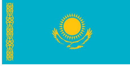
6. Resim: Kazakistan Cumhuriyeti Bayrağı.

Mavi renkli Kazakistan bayrağı dikdörtgen şeklindedir. Bayrağın ortasında parlayan güneşin altında kanatlarını açmış, uçmakta olan bir kartal vardır. Solundaki altın renkli şerit eski Altın Ordu devletini ve Kazakistan'a ait kültürü ifade eder. Bayrakta sözü geçen bu unsurlar sarı renklidir. Armanın merkezinde güneşin altında yer alan kanat açmış bozkır kartalı özgürlük ve bağımsızlığı simgelemektedir (MAPNALL, 2022).