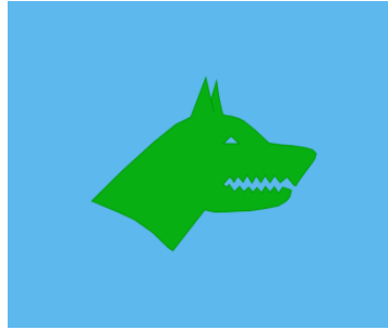
9. Resim: Ortasında Kurt başı tasviri olan Göktürk Devletinin Bayrağı.

Göksu, (2016:119) yaptığı araştırmada “Başta sanat tarihçileri, arkeolog ve tarihçiler olmak üzere farklı disiplinlere mensup birçok araştırmacı, çift başlı kartalın eski Türk inançları, Türk mitolojisi, Türk sanatı ve Türk halk edebiyatında da mevcut olup İslamî dönemde dahi varlığını devam ettirdiğini ortaya koymuşlardır” sonucuna ulaşmıştır. Türk toplumları tarafından kartal, çift başlı kartal figürleri en çok kullanılan ikonografik öğelerden biridir. Çift başlı kartal figürü Selçuklularda devlet sembolü, hakimiyet alameti olarak kullanılmıştır.